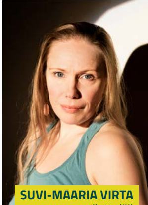
SUVI-MAARIA VIRTÄ näyttelijä