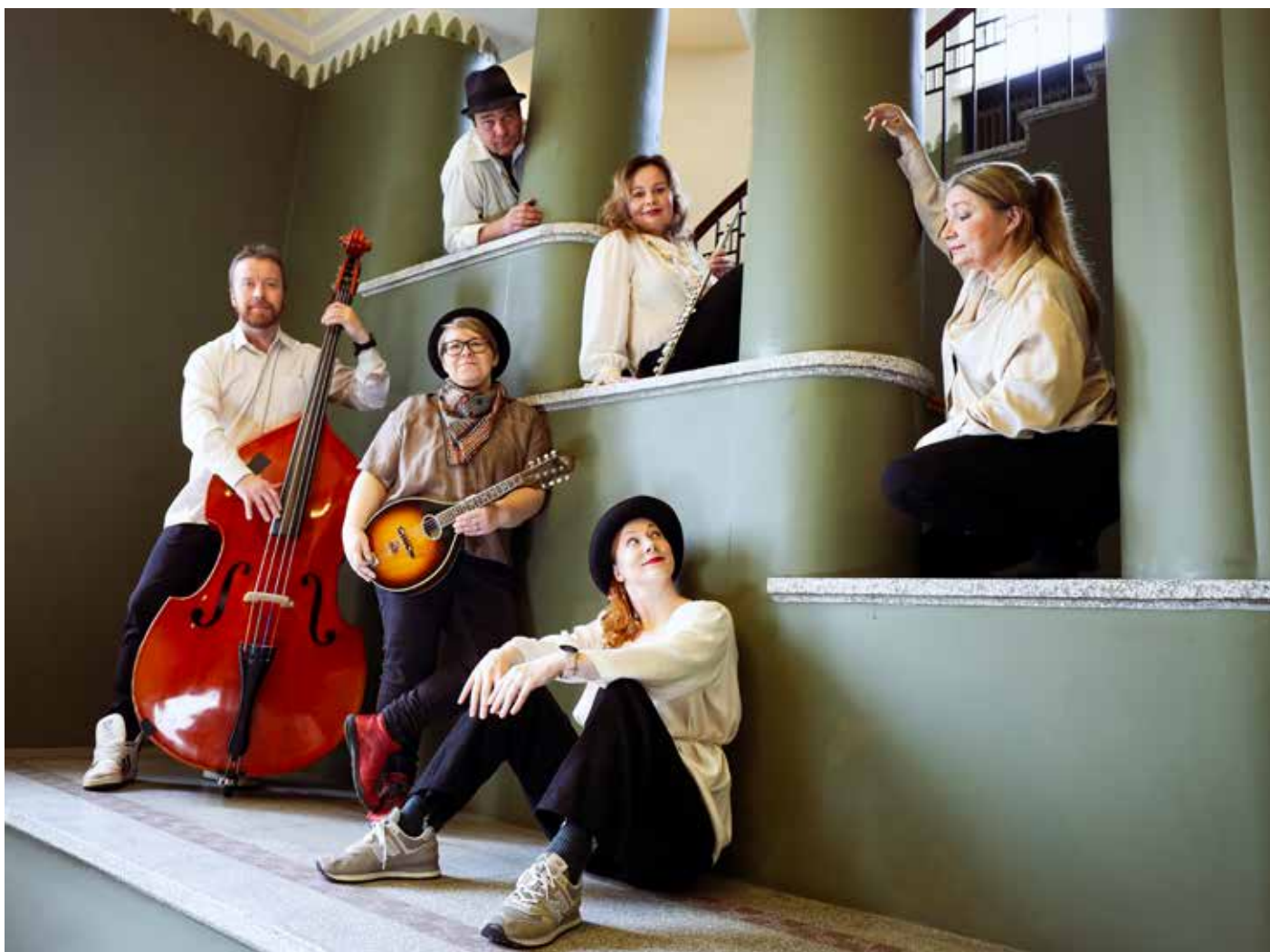
Syyskaudella Laulu-yhtye Eve-Green esitti ikivihreitä iskelmiä musiikkipuoltuntisissa hoiva- ja palvelukodeissa.

vakodissa mm. Ylämyllyllä, Kontioniemessä, Valtimolla ja Uimaharjussa ja katsojia kertyi yhteensä 222 henkeä.