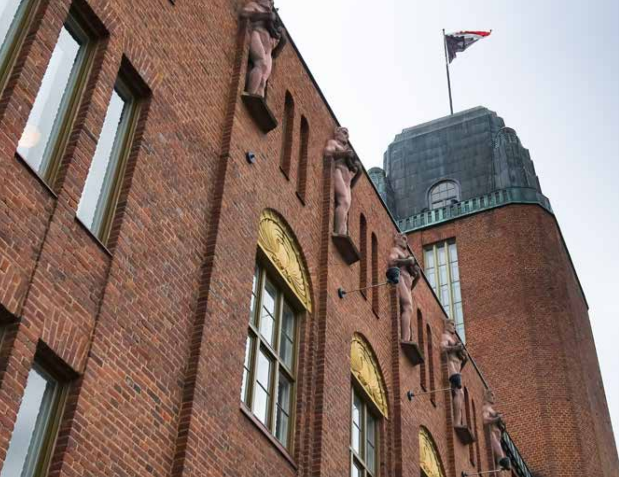
Joensuun kaupunginteatterilla valmistauduttiin museoremonttiin syksyllä 2023.