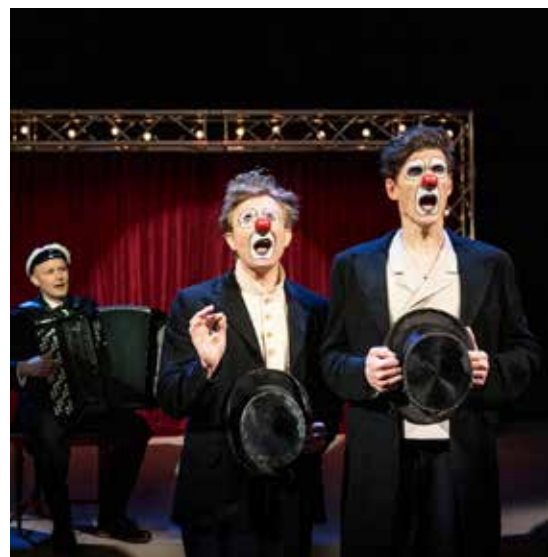
Red Nose Company: "Aleksis Kivi".

Vuonna 2023 kiertuenäytäntöjä oli 12 ja niissä oli katsojia yhteensä 874.