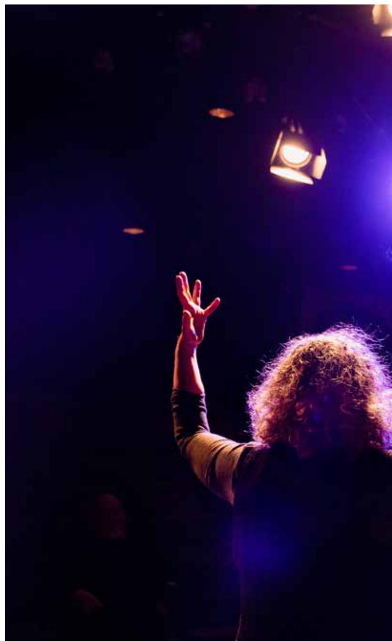
"Anjan lähes erinomainen elämä".

Kevätkauden taidenäyttelyt olivat: Sanni-Maaria Puustisen suurikokoiset piirustukset "Mitä sä oot – kuka sie oot" (Hirvimetsä), Juhani Tuomen öljyvärimaalauksia "Vietelyksiä" (Vaarallisia suhteita), Outi Piironen-pienoisveistoksia "Mie pääsin siitä yli" (Anjan lähes erinomainen elämä) sekä Petri Halttusen akryylimaalauksia "Pahaa sutta ken pelkäisi" (Iso paha susi).